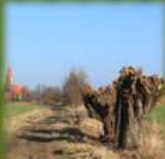
Wege- und Sichtachsen

sind der Erhalt, der Schutz und die Förderung des dörflich-ländlichen Charakters Biestows, der landeskulturellen Besonderheiten in der Biestower Feldflur und seine bedeutsame Funktion als Naherholungs- und Freizeitstandort.