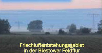
Frischluftentstehungsgebiet in der Biestower Feldflur